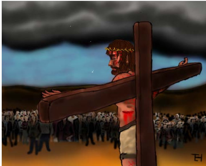
Christ died for sinners!

1 NJOANA 4:10 Na wendo bûbû bûkari ûûgû. Ti tiû tweendire Ngai, îndî i Ngai aatwendire aatûma Mwana wake atuîka kîgongwana gîa gûtûma tûrekagîrwa meeyia meetû.