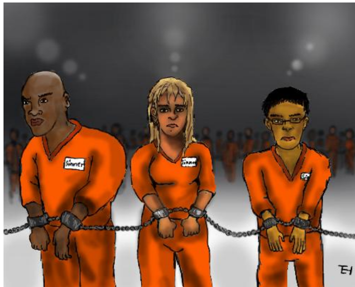
We are all sinners!

John 3:19 ብርሃንም ወደ ዓለም ስለ መጣ ሰዎችም ሥራቸው ክፉ ነበርና ከብርሃን ይልቅ ጨለማን ስለ ወደዱ ፍርዱ ይህ ነው።