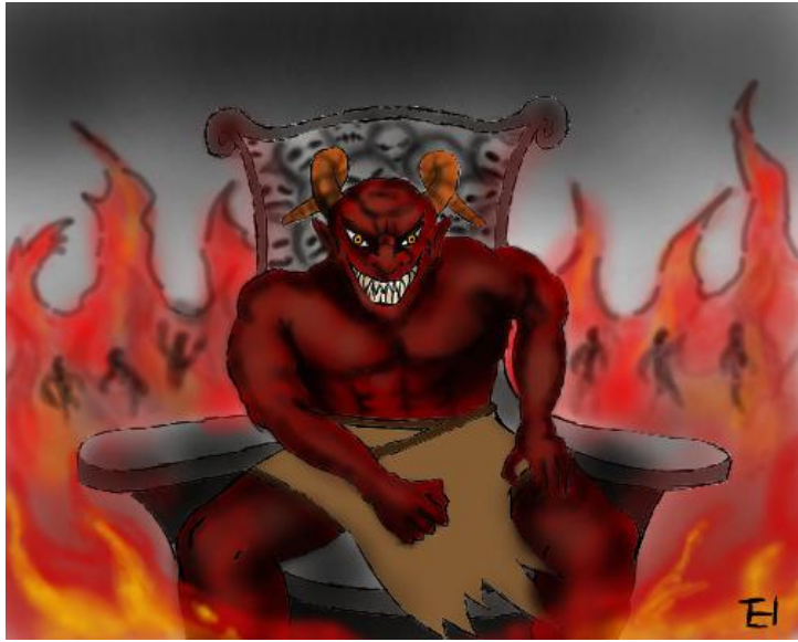
There is a cost for sins!

John 3:36 በልጁ የሚያምን የዘላለም ሕይወት አለው፤ በልጁ የማያምን ግን የእግዚአብሔር ተግባር በእርሱ ላይ ይኖራል እንጂ ሕይወትን አያይም።